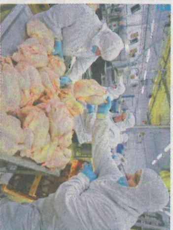
L'entrepris la plus lourdement sanctionnée est LDC Sablé, avec 5 millions d'euros de pénalité.

PARIS - Vingt et un industriels du secteur de la volaille, dont LDC (Loué, Le Gaultois...), Duc et Gastronomie, et deux fédérations professionnelles ont été condamnés pour une entente, écopant d'une amende globale de 15,2 millions d'euros, a annoncé, hier, l'Autorité de la concurrence. Les industriels ont été condamnés pour s'être concertés de manière coordonnée «en vue de réduire l'incertitude dans le cadre de leurs négociations commerciales» avec la grande distribution entre 2001 et 2007, a souligné l'Autorité. Le gendarme de la concurrence précise toutefois avoir minoré le montant de l'ensemble des amendes, car «la plupart des entreprises n'ont pas contesté les faits» et pour tenir compte des difficultés rencontrées par la filière.